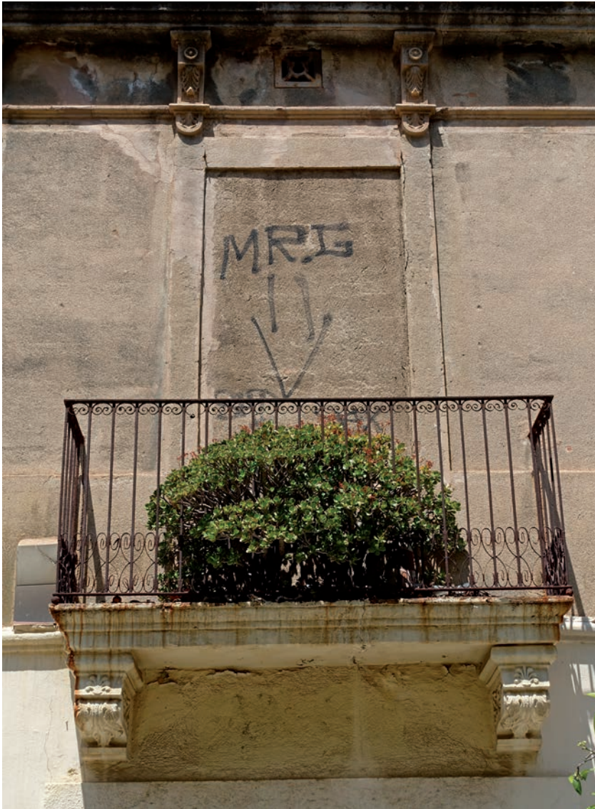
Un balcó tapiat del passatge Mas de Roda, al Poblenou.

través d'un enfilall de vivències, clarament descrites, perfilades, inconfusibles. « El zoo barcelonés es uno de los mejores en Europa », llegeix l'autor en un vell diari i pensa: «Que bèstia. Quin esforç per evitar ser engolits pel no-res, definir una identitat, dibuixar un territori.» El barri de la Plata està, com tota entitat conceptual, obsessionat per definir-se, per distingir-se dels altres. Bourdieu, en la seva definició de l'espai simbòlic, cita directament Émile Benveniste, una autoritat en la ciència del llenguatge que pot certificar la importància del principi de distinció com a tal. I el lingüista sentència: «Distingir-se i significar és una mateixa cosa». Les diferències visibles, signifi-