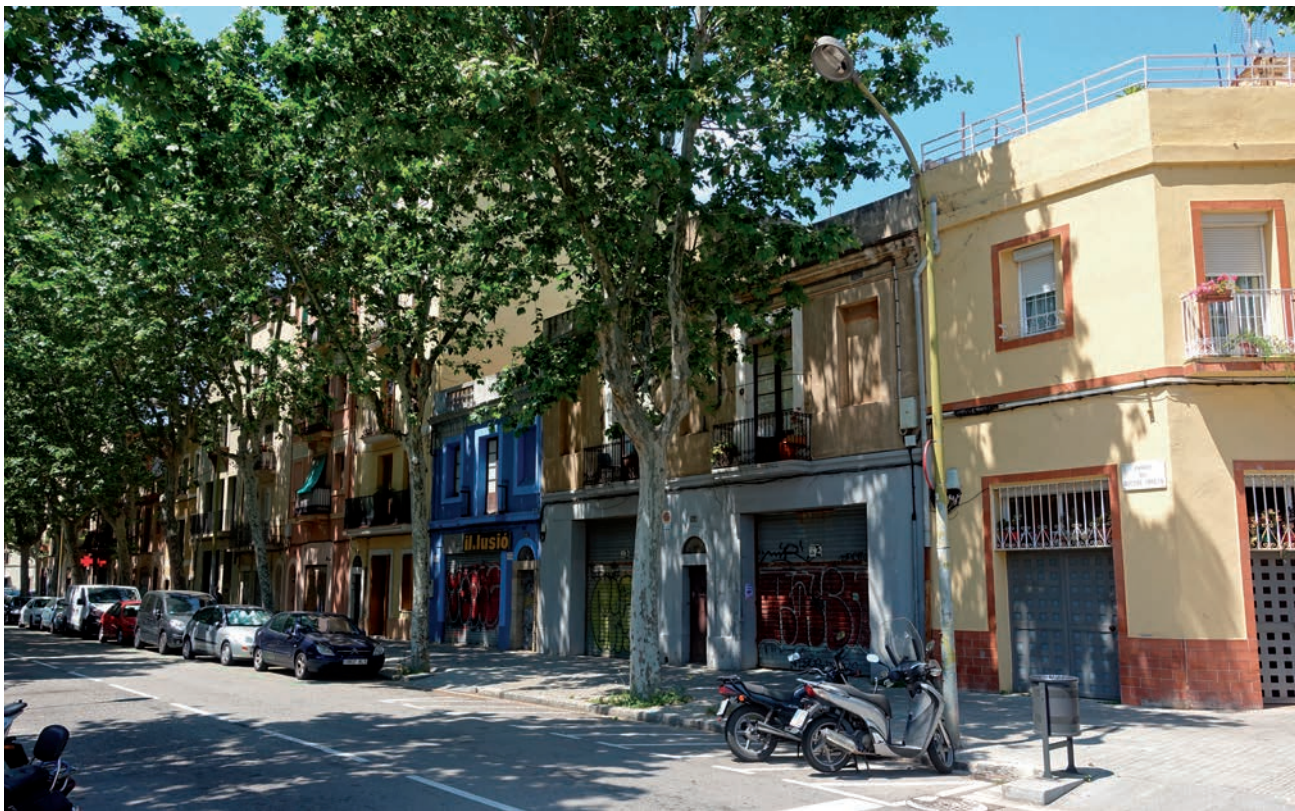
El segment del carrer Doctor Trueta, abans carrer Wad-ras que articula el dit barri de la Plata, al Poble Nou de Barcelona.

pot passar. A cada control, busco el mot de pas adequat, la consigna que permeti continuar el camí de la manera més ràpida. I si vaig distreta, les claus, la targeta de crèdit o de metro, els documents d'identitat i les contrasenyes m'acaben semblant substituïbles. Serveixen per anar d'un lloc a l'altre i tant se val quina fas servir a cada moment.