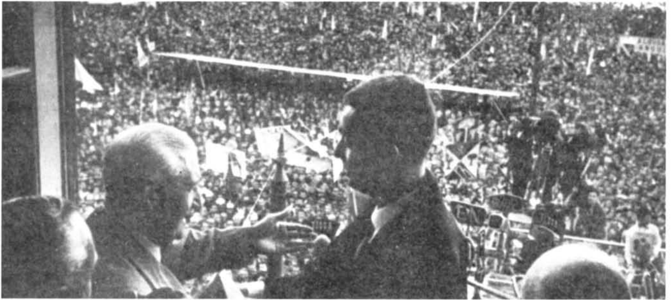
Manifestació multitudinària de suport a Oliveira Salazar. El dictador s'adreça a la multitud agraint la seva presència.

guerra. Una amalgama heterogènia de forces —feixistes, tradicionalistes, catòliques...— que lliutaven per dirigir la institucionalització definitiva de la dictadura sense que cap d'elles no tingués autèntica força per imposar-se absolutament sobre les altres. Això explica que la dictadura sempre renunciés a una institucionalització en fórmules jurídiques o constitucionals i que s'accontentés amb un seguit de Lleis Fonamentals que mantenien aquesta ambigüitat, utilitzada per Franco per imposar un equilibri eficaç sobre totes les anomenades famílies polítiques a través de la seva pròpia funció arbitral. Però també permet comprendre com al llarg de la dictadura es van succeir fases en què alguna família va aconseguir imposar un cert predomini, ja que en el règim franquista sempre va haver-hi un soterrat debat polític en un doble sentit: la renúncia a l'ocupació de la totalitat de la societat i la tolerància de, segons l'expressió del mateix Franco, un «legítim contrast de parers», sempre que no atacés la permanència del dictador en el poder. Malgrat tot, era també un aspecte que responia a les necessitats del regim en la seva relació amb l'exterior i a la funció de la política exterior com a element de subjecció i de perdurabilitat de la pròpia dictadura.