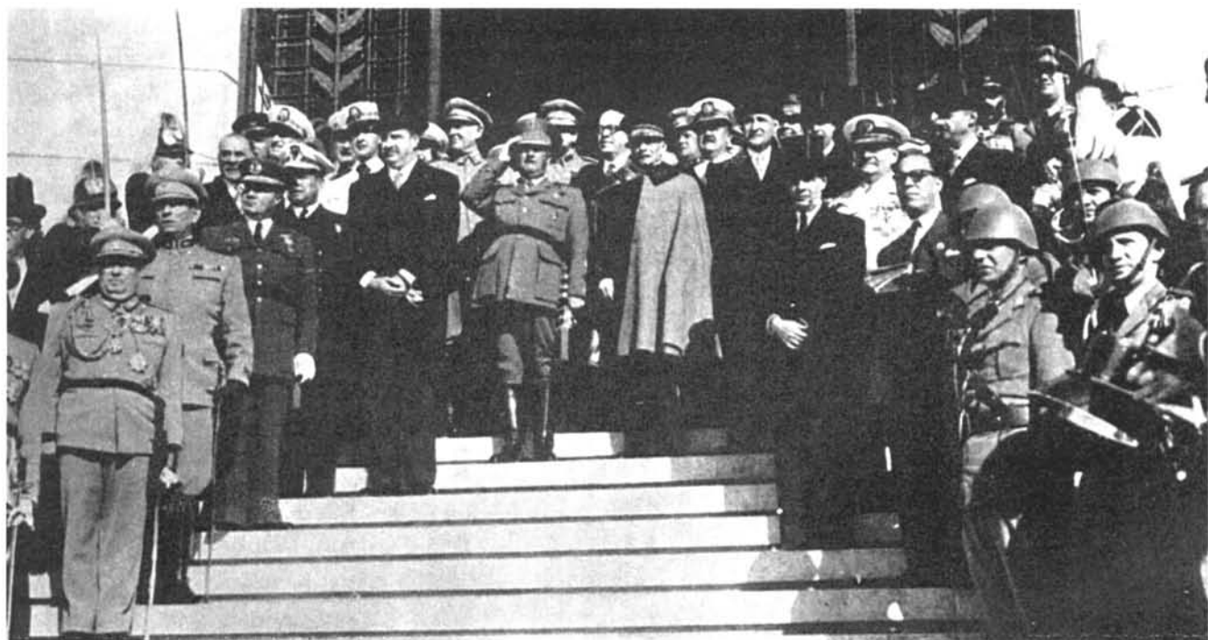
El general Franco a l'aeroport de Lisboa el 1949, després de fer una visita a Portugal.

Tanmateix, fins al 1942 tant el franquisme com el salazarisme van optar per un europeisme menys atlàntic i més continental, més proper a les concepcions italoalemanyes, és a dir, d'inserció dins d'aquesta atmosfera feixista que cobria la vella Europa.