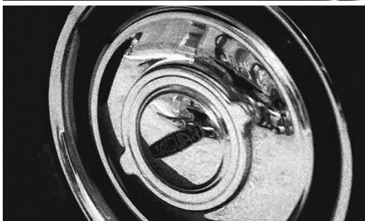
Nocturno 29 (1968), de Pere Portabella. Lucía Bosé cruza la calle de la fábrica, sube a la planta, descubre la máquina y pone en marcha el movimiento.