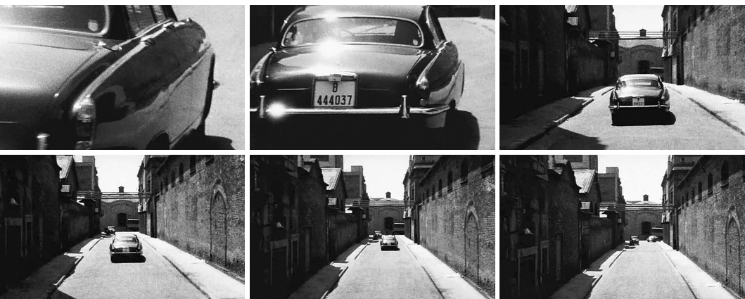
El Jaguar de Lucía Bosé avanza por el pasaje Mas de Roda y gira a la derecha, por la calle Badajoz, en Nocturno 29.

El pasaje Mas de Roda volvía al olvido, de donde había salido momentáneamente aquella tarde en la Filmoteca. El interior debe ser can Batlló. Pero la escena del Jaguar se filmó en el pasaje Mas de Roda. No puedo estar equivocado: pasaba por allí todos los días. Ha desaparecido de los archivos de Films 59, como si nunca hubiera existido. Mi amigo Jordi Ribas dice que el tema de todo lo que escribo es la desaparición. Lo que pasó y se ha borrado, lo que ha sido suprimido, la memoria perdida de las cosas. Reúno restos, colecciono fragmentos para construir un espacio mental: el barrio de la Plata.